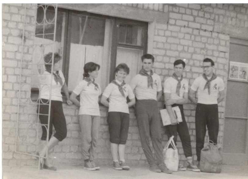
Фото 5. Рязанские ориентировщики в Туле, 196...г.