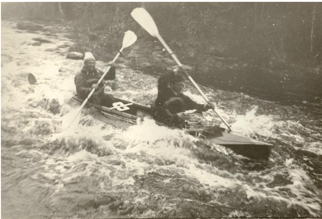
Фото 7. Первый поход по р. Воньга в Карелии, 1967г.