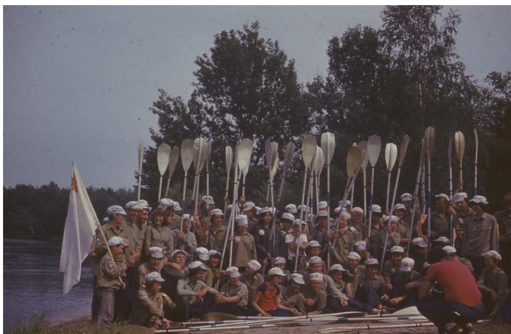
Фото 11. Лагерь «Аргonautы» семь лет спустя, 1982г.