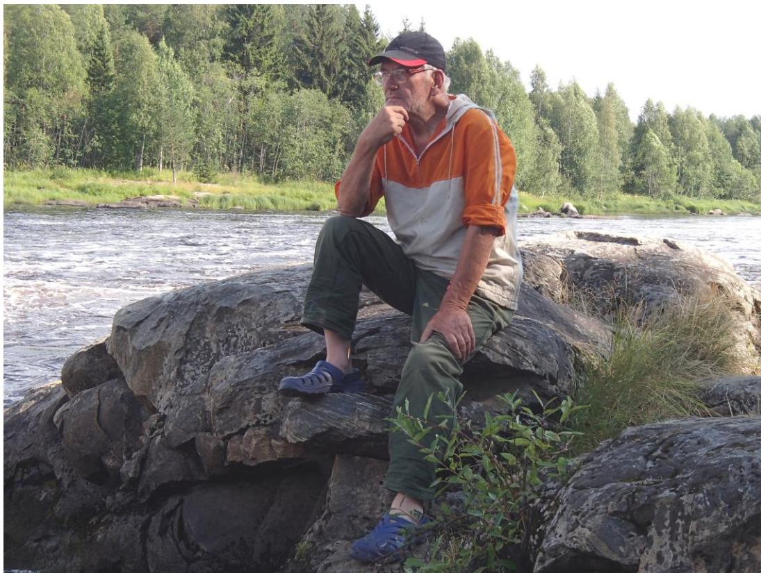
Фото 17. Река Водла через 44 года после первого знакомства, 2014г.