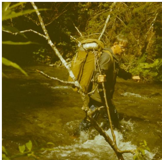
Фото 14. На Южном Сахалине, 1989г.