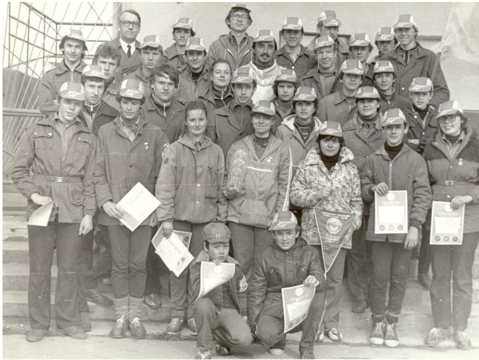
Фото 13. С подростковым клубом «Комета» на слёте «Будь готов»