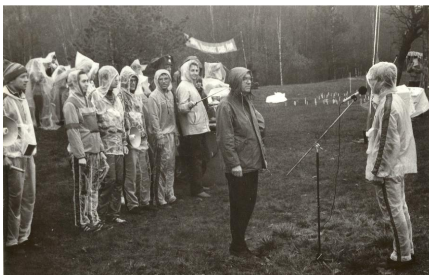
Фото 12. Открытие юбилейного слета клуба «Альтаир», 1982г