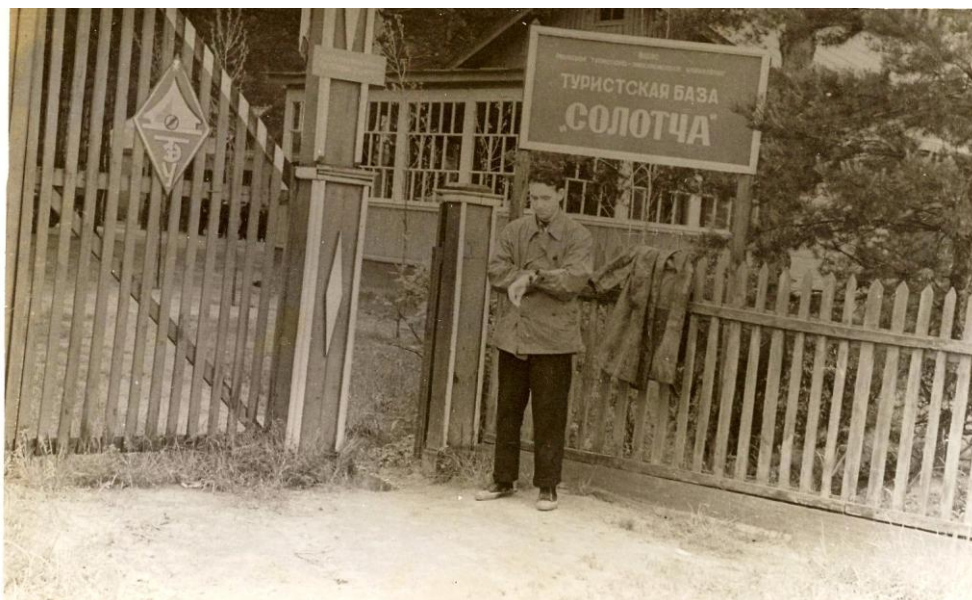
Фото 1. Турбаза «Солотча». Начало отсчета туристского времени, 1960г.