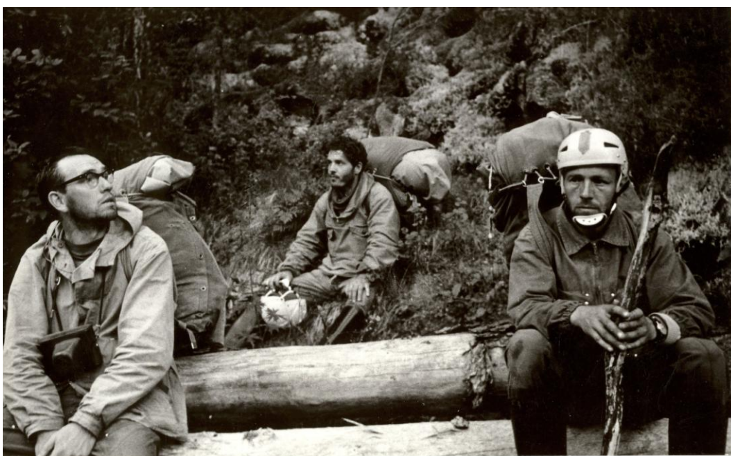
Фото 9. На подходе к р. Оке в Саянах, 1973г.