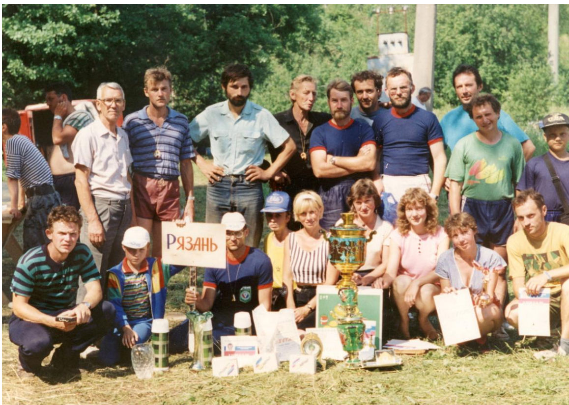
Фото 16. Победители в спортивной и конкурсной программах на фестивале туристских клубов России, 1995г.