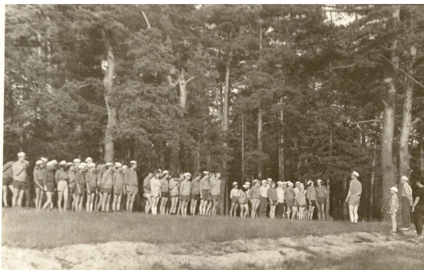
Фото 10. Открытие лагеря «Аргonautы», 1975г.