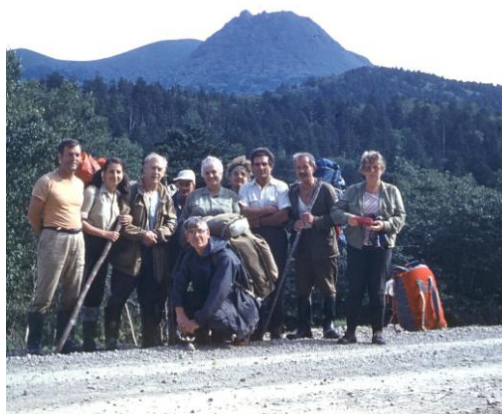
Фото 15. На острове Кунашир, 1989г.