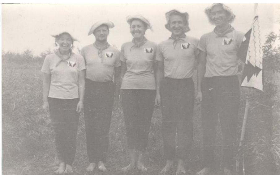
Фото 4. В водной экспедиции «Мещёрка», 1964г.