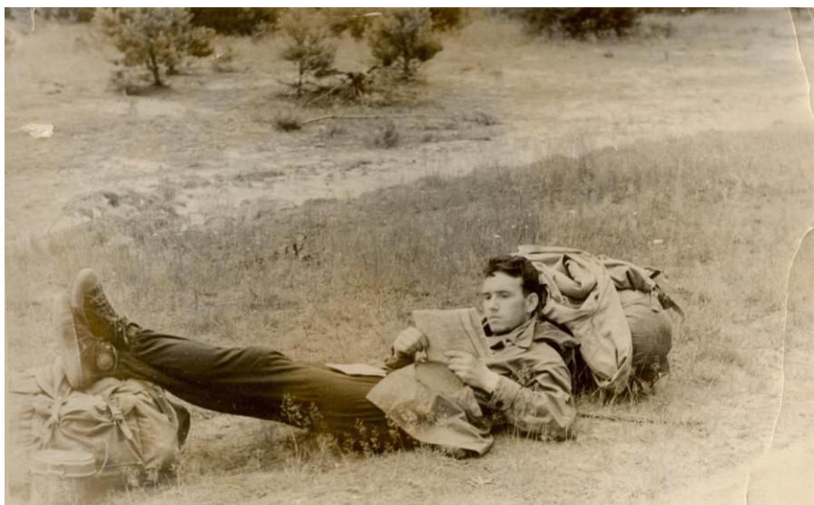
Фото 3. В пешеходной экспедиции по Мещере, 1963г.