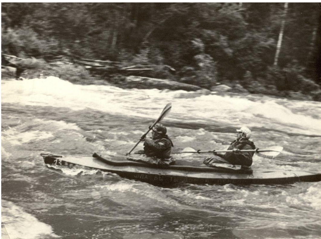
Фото 8. Всесоюзные сборы на р. Кантегир, 1972г.